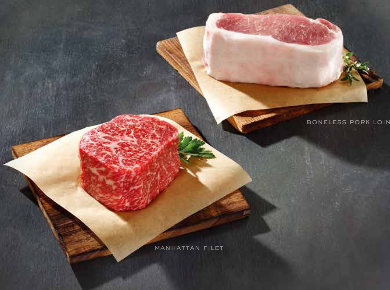
BONELESS PORK LOIN