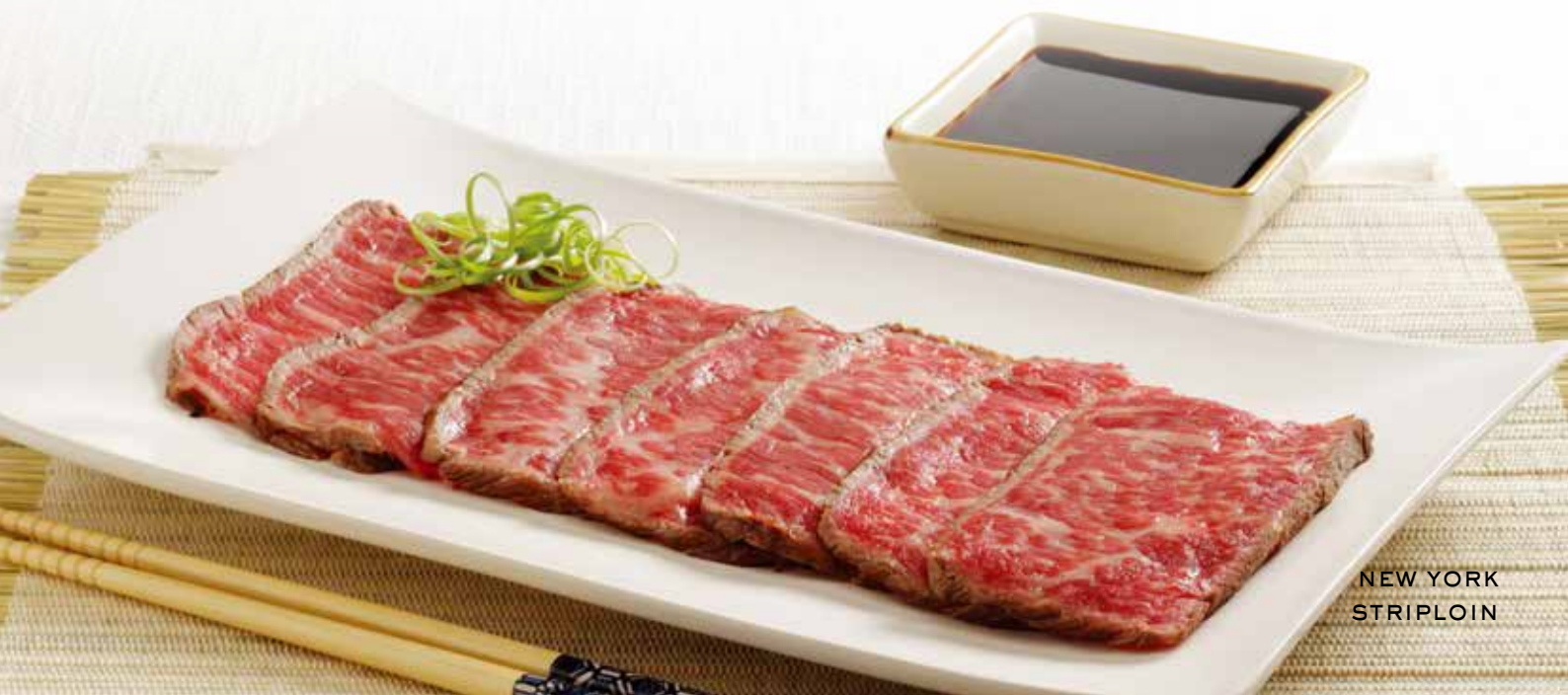
NEW YORK STRIPLOIN

お問い合わせ先：ファームランドトレーディング株式会社 東京都港区虎ノ門 3-22-1 Tel: 03-3431-4151